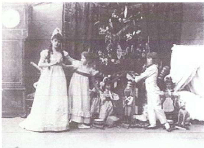
9. Балет «Щелкунчик»