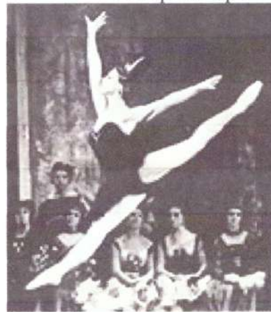
5. М. Плисецкая