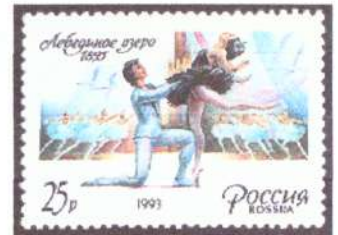
6. Почтовая марка России из серии «Рус- ский балет», выпу- щенная к 175-летию со дня рождения М. И. Петипа.