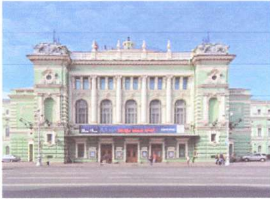
1. Мариинский театр. Санкт-Петербург