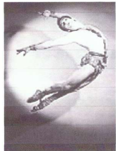
8. М. Лиепа