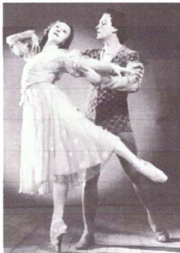
4. Г. Уланова и Ю. Жданов в балете «Ромео и Джульетта»