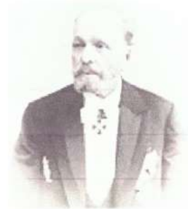
3. Мариус Петипа